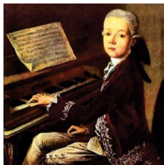
De jonge Mozart