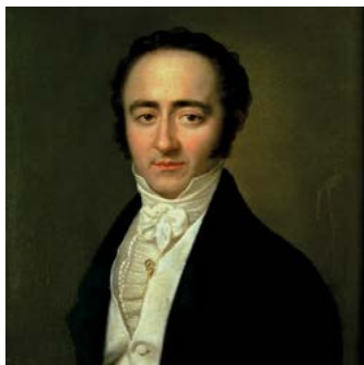
Franz Xaver Süssmayr