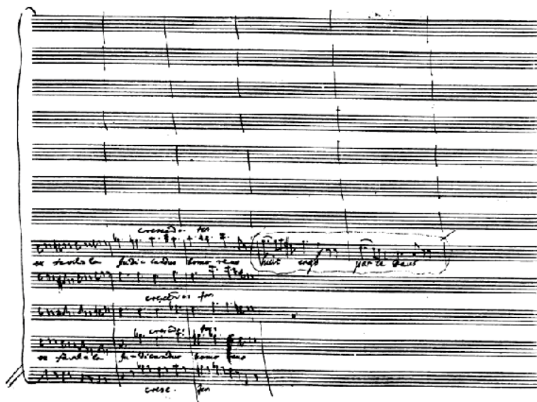
Begin van het deel Lacrimosa: de acht maten die Mozart ervan componeerde en een paging van Eybler om het vervolg te schrijven.